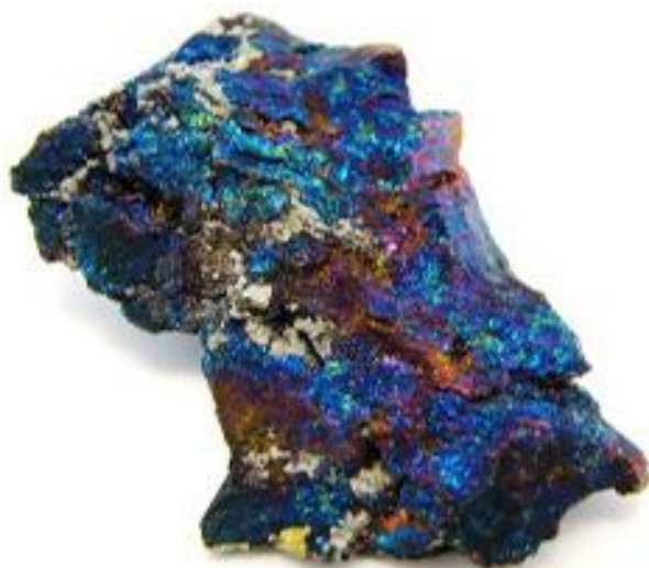
bornite-minerai du paon