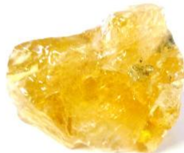
Calcite miel- Calcite dorée