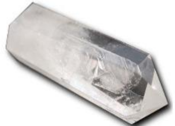
cristal de roche